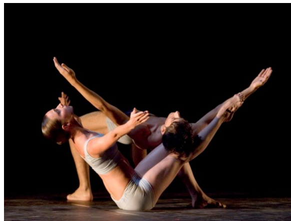
Europa danse by Logvinov 29-7-05